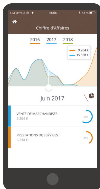
Aperçu en version mobile